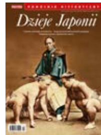
Na okładce: Zawodnicy sumo, sztuki walki, która do dziś ma silny wymiar rytualny; kolorowana fotografia z ok. 1880 r.