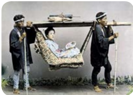
Od góry: Niemiecki podróżnik Waldemar Abegg (w środku) podejmowany w Japonii herbatą, fot. z 1906 r. Kobieta niesiona w rodzaju lektki, fot. z ok. 1880 r.