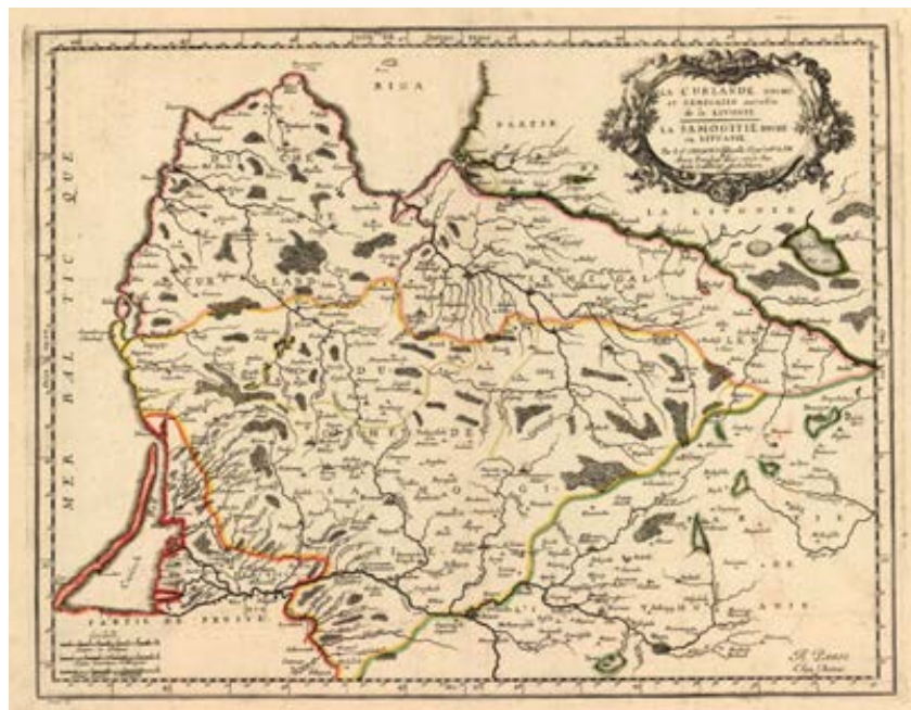
Kurlandia, Semigalia i Żmudz na mapie z XVII w.