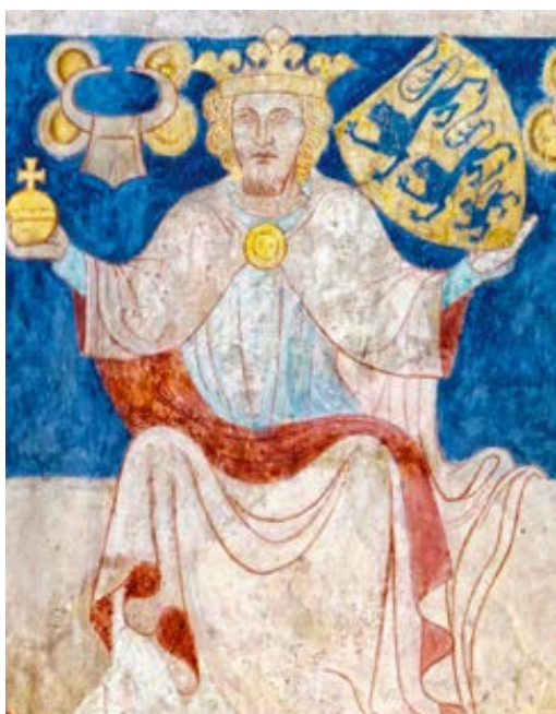
Waldemar II Zwycięski, król Danii (1202-41); fresk z kościoła św. Benedykta w Ringsted.